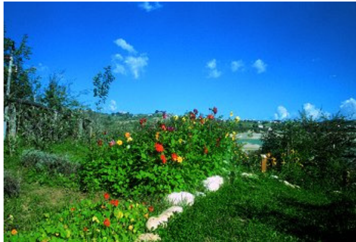
Veduta di una parte del sentiero che attraversa il giardino delle farfalle

Percorrendo il Sentiero delle piante officinali si incontra il Giardino delle farfalle: