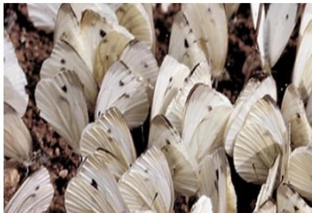
Assembramento di Pieris napi sul terreno umido, per la suzione di sali minerali

Lungo il percorso del Giardino delle farfalle si possono trovare delle tabellazioni illustrative che raccontano il ciclo delle farfalle più colorate e più comuni che è possibile vedere, nonché i loro specifici legami con il mondo delle piante.