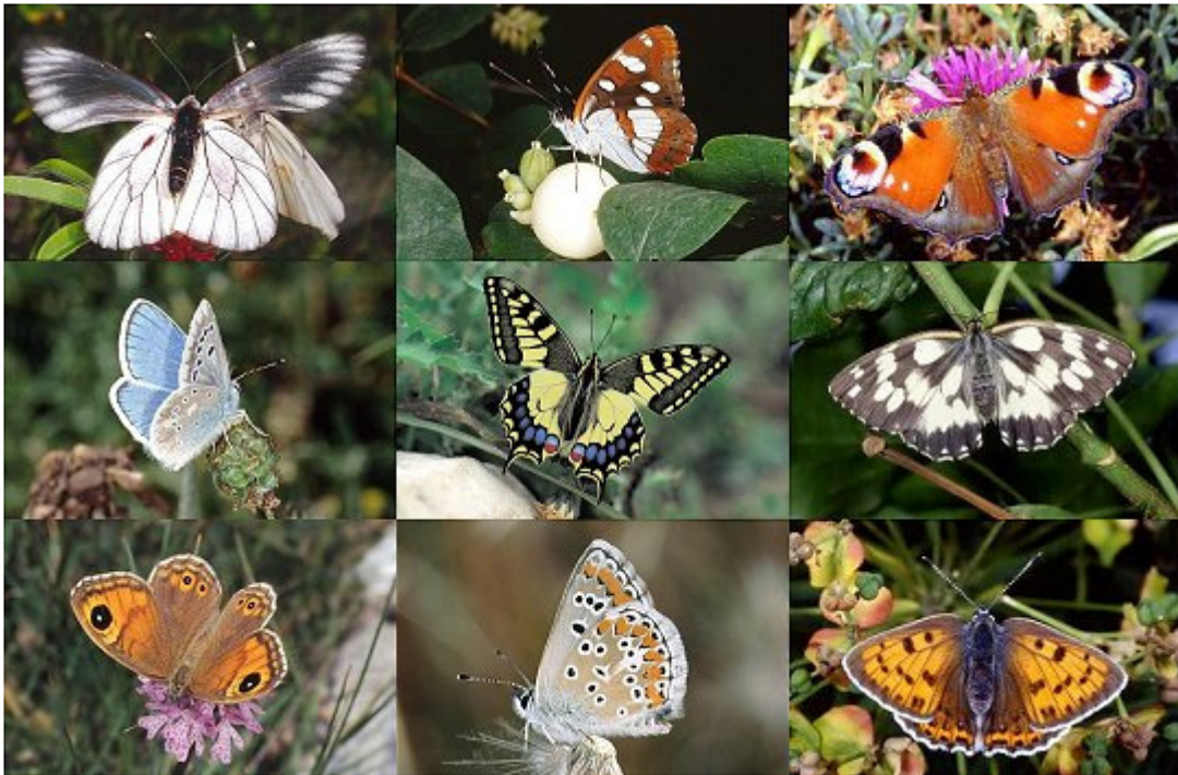
Alcuni esempi di farfalle che si possono incontrare nel Giardino della Riserva

Percorrendo il Sentiero delle piante officinali si incontra il Giardino delle farfalle: