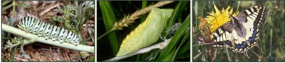
Ciclo vitale di una delle farfalle più comuni e vistose in questo giardino, il macaone ( Papilio machaon ): bruco, pupa e adulto

Carta della vegetazione presente nel Giardino delle